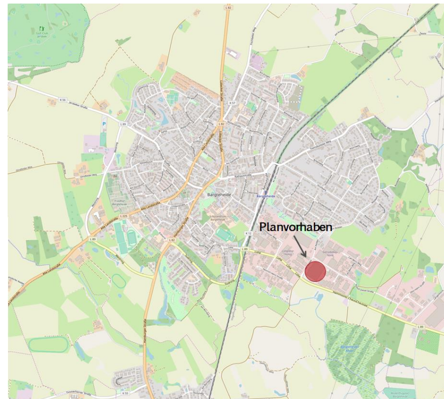
Abb. 1: Lage des Planvorhabens in Bargteheide (Makrostandort)

Kartengrundlage: openstreetmap; Bearbeitung durch die cima 2020