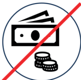
Kein Geldverkehr Geldautomaten, Kassen