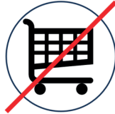
Kein Einkauf Nahrungsmittel, Treibstoff