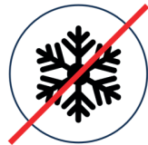
Keine Kühlung Kühlschränke sowohl privat als auch im Handel