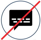
Keine Kommunikation Handy, Internet, Telefon, Notruf