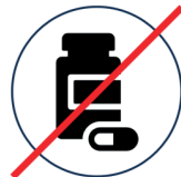
Keine Medikamente Apotheken