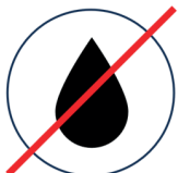
Kein fließend Wasser Sowohl Trinkwasser als auch Abwasser